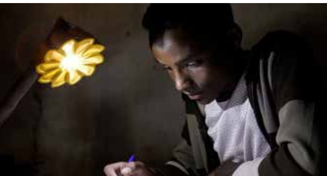
Olafur Eliasson, Little Sun, 2012

En la actividad práctica se solicita que los estudiantes trabajen en grupos e identifiquen una problemática actual. Luego, con el fin de crear una campaña en redes sociales, tendrán que diseñar una imagen con su respectivo hashtag, haciendo un llamado a la sociedad para crear conciencia sobre la problemática escogida. Esta imagen debe ser compartida en las RRSS de cada grupo. www.artequin.cl