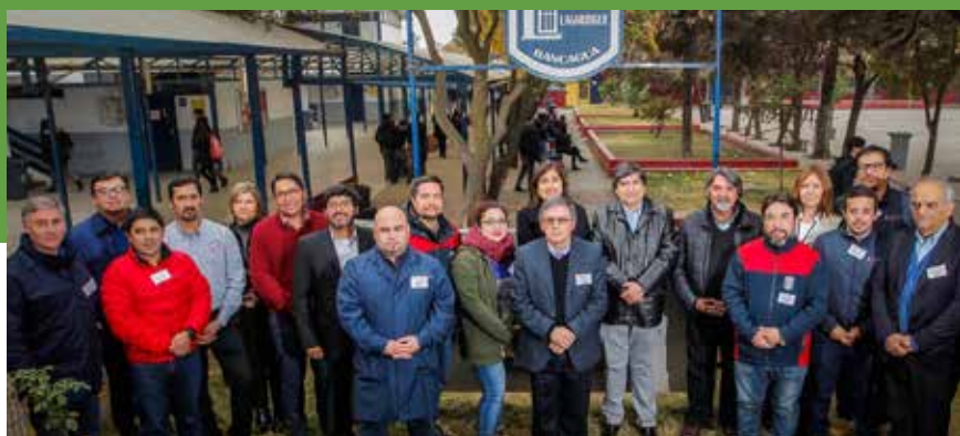
» Profesores de varios establecimientos de la RED de la Fundación Irrrázaval asistieron al encuentro de Construcciones Metálicas.