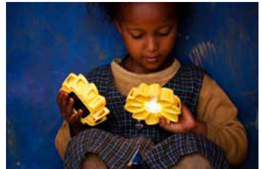
Olafur Eliasson, Little Sun, 2012.

Olafur Eliasson es un ejemplo de cómo los artistas de nuestra época están conscientes de los problemas actuales y son capaces de crear obras, productos o creaciones estéticas que no quedan solo en la forma, sino que proponen soluciones prácticas. En suma, el artista no puede desentenderse de la época en la cual le tocó vivir y, con ello, de las problemáticas que le son propias al momento de crear su obra.